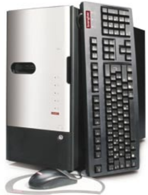
Aktuelle transtec Graphics Workstations unterstützen neben den aktuellen Intel CPUs auch bis zu zwei Dual Opteron Socket F CPUs und verfügen über bis zu 16 GB Hauptspeicher